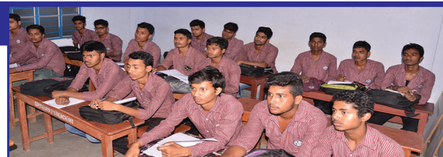
Audio Visual Room